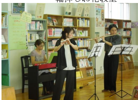
なんちゅうホッとライブラリー