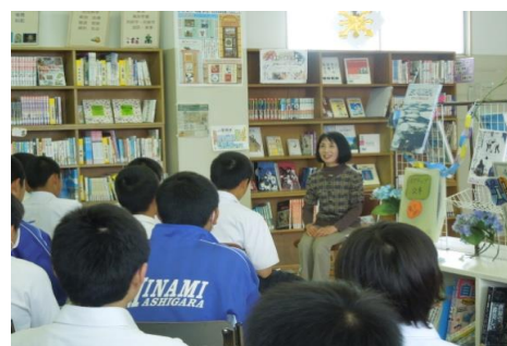
なんちゅうホッとライブラリー