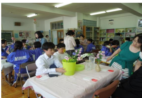
一輪挿しお花教室